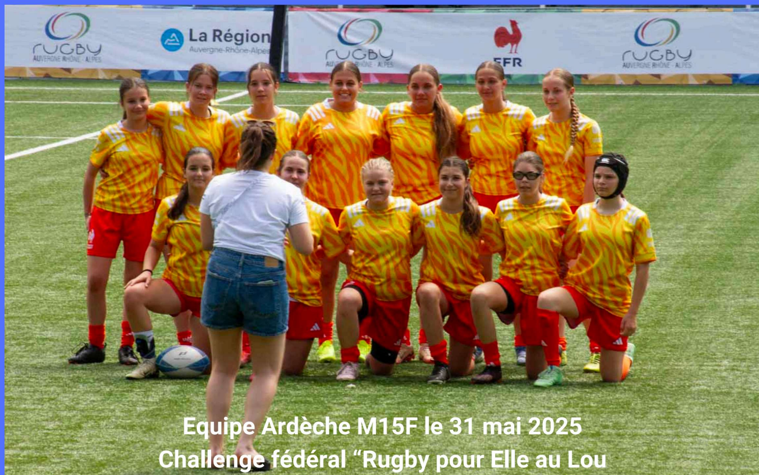
Equipe Ardèche M15F le 31 mai 2025 Challenge fédéral "Rugby pour Elle au Lou"